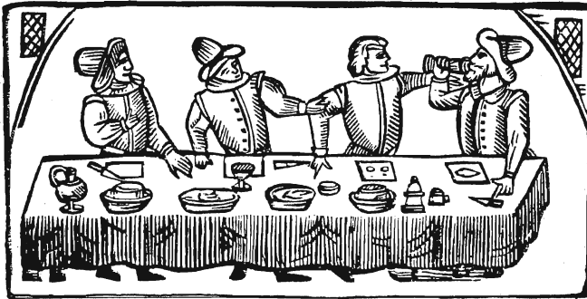
Eskimojäätelön nautiskelua 1600-luvulla.

Traaniöljyn voi vatkata tavallisella tukevalla käsivatkaimella tai suuri-tehoisella sähkövatkaimella, hylkeenrasvaan on parempi käyttää lyhytkahvaista puutarhaharaa tai vanhanajan jäätelökonetta. Kun rasva tai öljy on kuohkeaa, sekoitetaan siihen karpalot ja silputut suolaheinän lehdet, seos kaadetaan peltisankoon tai pesuvatiin ja asetetaan hankeen jääty-mään (jos tämä ei ole mahdollista, voidaan jäädytys hätätilassa suorittaa pakastimessa). Jäätynyt jäätelö pilkotaan kirveellä sopivan-kokoisiksi annospaloiksi ja nautitaan sellaisenaan jääveden tai palo-viinan kera. Vaihtelunhaluinen voi kokeilla karpaloiden sijasta suomuu-raimia tai variksenmarjoja. Ruokalaji sopii erityisen hyvin tarjoiltavaksi kotijuhlien päätteeksi, kun vieraat eivät vielä jostain syystä näytä olevan halukkaita lähtemään kotiin. Nautistelkaa!