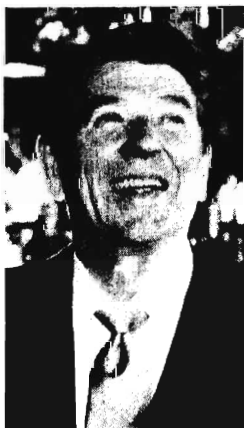
● Amerikansk revolutionär.

Ralf Gräsbeck har i "Medicinska gränser och utmaningar" redogjort för de problem den medicinska forskningen råkat ut för främst vid stipendiutdelningar och statligt understöd till forskning genom att det blivit så många icke mediciner som forskar inom detta område. Och visst har mycket som utforsksats av andra fackmän också varit till stor medicinsk nytta. Han nämner som exempel radioaktivitetens och röntgenstrålningens betydelse inom sjukvården. Andra exempel på förebyggande sjukvård är vaccinationer, antisepsiten och vattenhygien. Många andra exempel säger han kunde anföras, vilket bevisar att det nog är viktigt att det pågår forskning inom en vid sektor, men det är