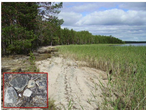
Kuva 8. Tirroniemen leirikeskukseen kenttätutkimusviikolla löytynyt kvartsikärki in situ (Kuva: Kolarin kunnan kotiseutumuseon kuva-arkisto/H. Oksala).

Kohtuulliset osallistujamäärät saavutetaan miltei ainoastaan niissä tapahtumissa, joista ilmoitetaan maakuntaradiossa. Paikallislehtien ennakkoilmoitukset eivät useinkaan riitä. Pajalan väkeä tavoitettiin Internetin kyläisivuille lähetettyjen ilmoitusten kautta.