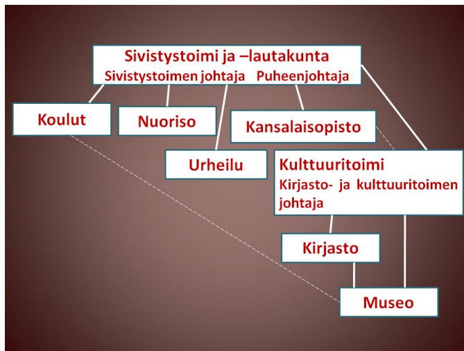
Kuva 2. Kolarin kunnan kotiseutumuseon hallintokaavio (Kuva: H. Oksala).

Vuodesta 1998 lähtien työjaksot ovat kestäneet 2–6 kk. Näyttelykaudelle palkataan lisäksi työvoimatoimiston esittämä paikallinen, vuosittain vaihtuva museoapulainen. Merkittävään työpanokseen tuovat myös 1–4 yläasteen tai lukion oppilaan kahden viikon työjaksot, joista ensimmäiset sijoittuvat kesänäyttelyn rakentamisvaiheeseen. Museolla on ympärivuotinen osa-aikainen kiinteistönhoitaja. Viitenä viime vuotena on Museoviraston myöntämällä rahoituksella palkattu museologian opiskelija 1–1,5 kuukaudeksi kokoelman ja sen luetteloinnin digitalisointitehtävään (kuva 3).