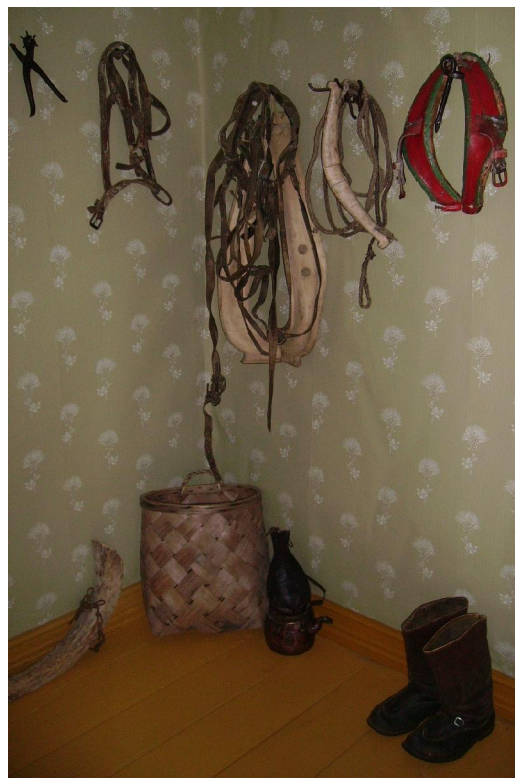
Kuva 4. Historiallista esineistöä Kolarin kotiseutumuseon kesänäyttelyssä: ovinurkkausasetelma ”lähdon tunnelmaa” (Kuva: Kolarin kunnan kotiseutumuseon kuvaarkisto/H. Oksala).

Ihmisen menneisyyttä koskevan tiedon on osoitettu liittyvän voimakkaasti yksilön tai yhteisön identiteettiin eli itsetuntemukseen ja kulttuuritietoisuuteen osana laajempaa maailmankuvaa ja olemassaolon kokonaisuutta – eksistenssiä. Museo palvelee ihmisen henkisiä tarpeita, jotka liittyvät menneisyydestä saavutettavissa olevaan tietoon. Merkityksellinen tieto voi välittyä jopa tunteiden kautta. Museon tuottamat elämykset, oivallukset, luovat kokemukset ja merkitykset ovat luonteeltaan kognitiivisia eli älyllisiä, emotionaalisia ja siten psykologisia. Menneisyyttä koskevalla tiedolla, sen tarjonnalla ja saavutettavuudella on selvä yhteys ihmisen hyvinvointiin. Museoiden rooli olisikin ymmärrettävä peräti kansan- ja mielenterveyttä edistävänä, eheyttävänä, voimaannuttavana sekä yhteisöllisyyttä tukevana toimintana. (Vrt. Kallio 2007: 121). ”Museot - - vahvistavat - - väestön ymmärrystä kulttuurista, ympäristöstä ja” menneisyydestä. Perinnön ja ”kulttuurien tuntemus lisäävät vakautta ja suvaitsevuutta” yhteisötasolla. (Siteeraukset Karvonen ym. 2007: 6). Tällaisen virikkeellisyuden tekee mahdolliseksi museon ensim-