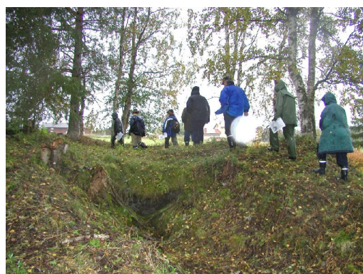
Kuva 7 a-c. Muinaispolun peltoröykkiö (ylh. vas.), riihileipomon pohja (alh.) sekä tervahauta (ylh. oik.).

Muinaispolun raivaaminen museon lähimetsikköön Museoviraston hoitoyksikön ohjauksessa 2005 ja siihen liitetty osallistuminen Arkeologian päiviin avajaisten muodossa oli yleisömenestys. (Kuva 7). Seuraavana vu-