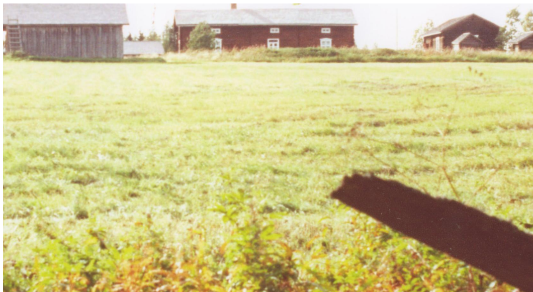
Kuva 1. Kolarin kunnan ulkomuseon silhuetti muinaispolulta nähtynä (Kuva: Kolarin kunnan kotiseutumuseon kuva-arkisto/H. Oksala).

keruussa, tallennuksessa, tutkimisessa ja esitelyssä yleisölle näyttelyiden, opetuksen ja julkaisujen muodossa. Tehtävänä on paikallisen museotoimen kehittäminen yhteistyössä ”museaalisten” viranomaisten, järjestöjen ja matkailuyrittäjien kanssa. Museota pidetään avoimena kesäkuukausina, eikä se saa tuottaa taloudellista voittoa. (Toimintasääntö 1986.)