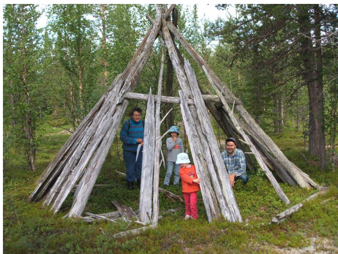
Kuva 6. Myös kesällä 2008 toteutettu matka Ruotsin Pajalan Kiuhtisjärven kulttuuripolulle sai yllättävän suosion peräti kahdeksan osallistujan voimalla.

Museo tukee ja avaa paikalliskulttuurin tuntemusta menneisyyden näkökulmasta. Esim. Kolaria luonnehtii pohjoinen sijainti suurten rajajokien varsilla sekä alavan metsä-, järvi- ja aapasuomaiseman kohoaminen vaara- ja tunturiseuduksi. Nämä ovat vuosituhansien aikana vaikuttaneet kulttuuriin, aina esihistorian pyytäjästä metsäsaamelaisiin poronhoitajiin, etelän eränkävijöihin, Tornion pirkkalaisiin ja historiallisen ajan karjanhoitajiin ja pienviljelijöihin, miilun- ja tervanpolttajiin, kyläseppiin sekä metsä- ja kaivostyöväkeen. Nämä elinkeinot edelleen kätkeytyvät jäljellä olevaan kulttuurimaisemaan ja sen sisältöön, jonka hoito tulisi virallisesti liittää paikallismuseon toimenkuvaan. Kolarin kunnallista museota on mm. kokoelman luonteen perusteella pyritty suuntaamaan erityisesti, mutta tähän mennessä väljäkösti sotia edeltävien esiteollisten vaiheiden maa- ja rajaseutukulttuuriin. Mitä tämä voisi merkitä arkeologisen kehittämisen kannalta, kun arkeologian voidaan katsoa erityisen hyvin tukevan museoiden viimeaikaista suuntausta ympäristöti-