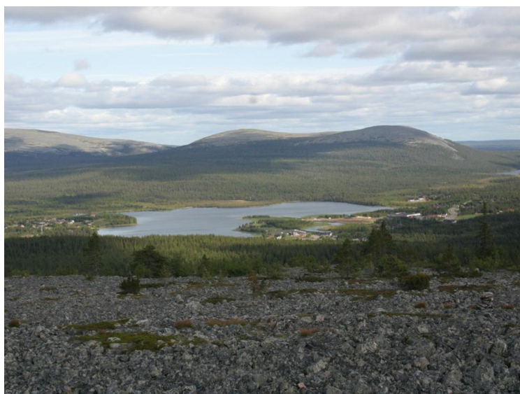
Kuva 5. Paikallismaisemaa Kuertunturilta kohti Äkäslompola ja Yllästunturia.

Museolla on vastuu paikkakunnasta ulospäin välittyvän tiedon laadusta ja sisällöstä, joiden ohjaimena omien kokoelmien lisäksi toimii koko alueen maisemaperintö em. perinteenlajien (aineellinen, henkinen, suullinen, kirjallinen) ohella. Paikallismuseoiden tehtävä on tunnistaa alueeseensa liittyvät erityiset kulttuuripiirteet, jotta niitä koskeva tiedonvälitys onnistuu. Paikalliskulttuuri profiloii museon toimintaa ja sisältöjä, joiden laajempiakin kytkentöjä on tuotava esiin. Kulttuuriperinnön säilyttämiseen tarvitaan hallinnon kehittämistä, tallennukseen tiedonhallintajärjestelmiä, tutkimukseen tiedekommunikaatiota, julkistamiseen kirjoittamista, raportointia,